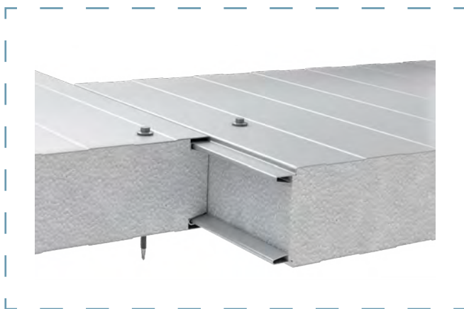
Schemat łączenia płyt